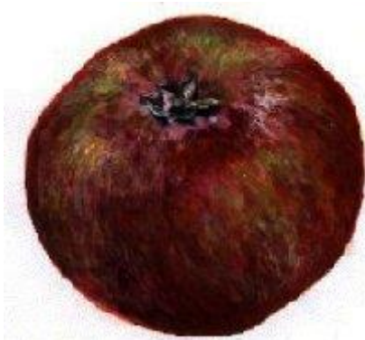
Tiré de Choisel Guide des Pommes 2000 ©