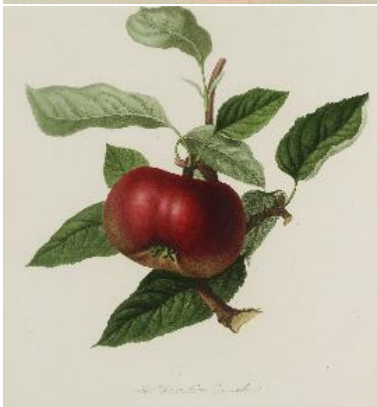
Pomona Londinensis 1818, William HOOKER.

ORIGINE: Normandie, à Carentan, Manche (50), vers 1676. Introduite en Angleterre depuis la Normandie.